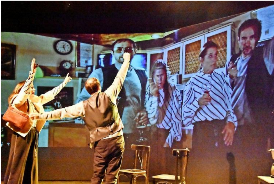
Video-Einspielungen geben der Inszenierung eine mediale und künstlerische Tiefe.